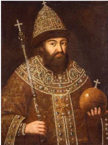
Михаил Федорович (1613-1645)