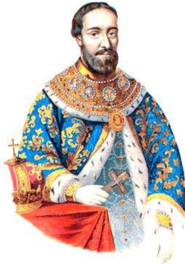
Федор Никитич Романов (Филарет)

2) В 1619 – 1633 гг. существовало фактическое двоевластие царя и его отца – патриарха Филарета.