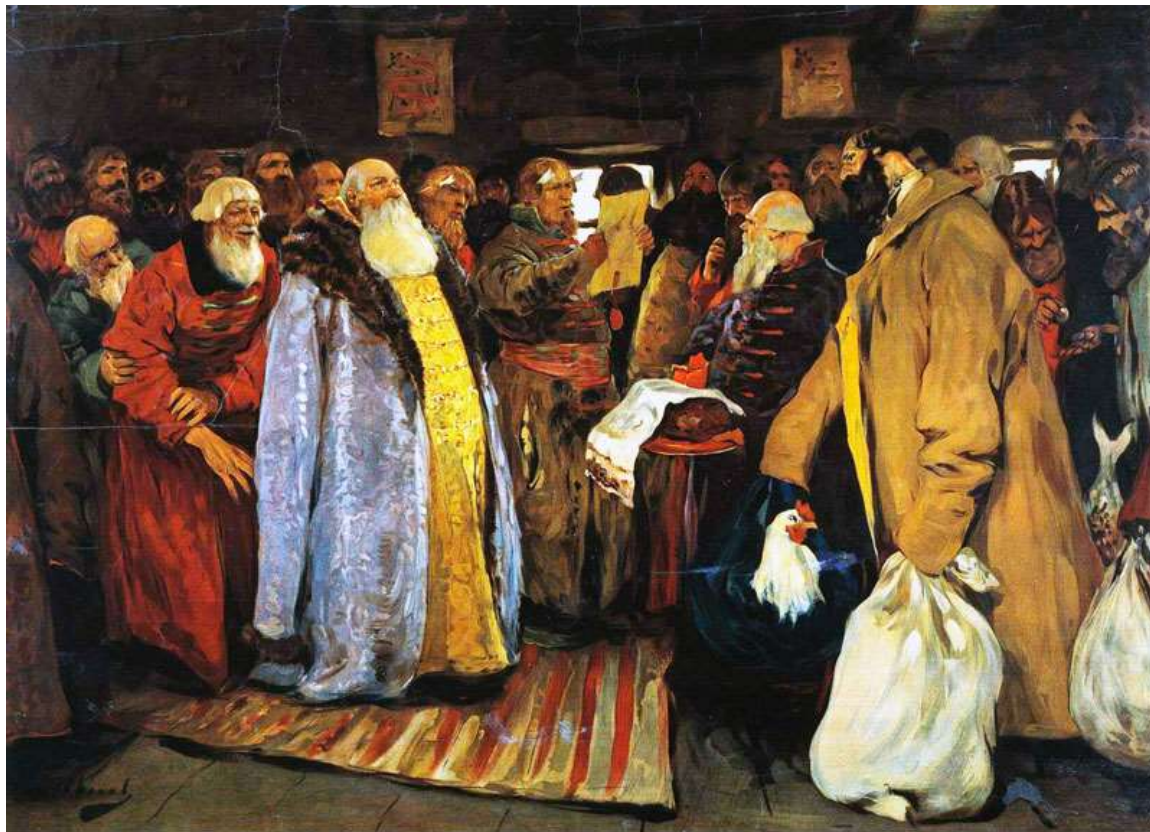
Иванов С.В. Приезд воеводы.

Воевода в XVII в. – государственный деятель, назначаемый царем, совмещавший административные и военные функции в управлении определенной административно-территориальной единицей и военными формированиями.