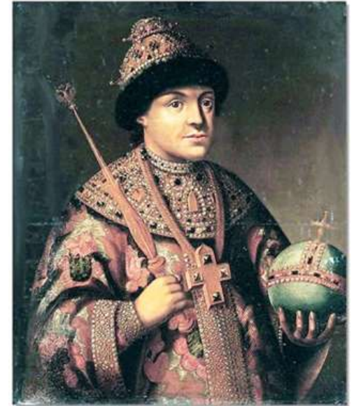
Федор Алексеевич (1676-1682)