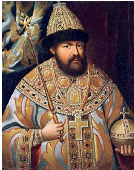
Алексей Михайлович (1645-1676)