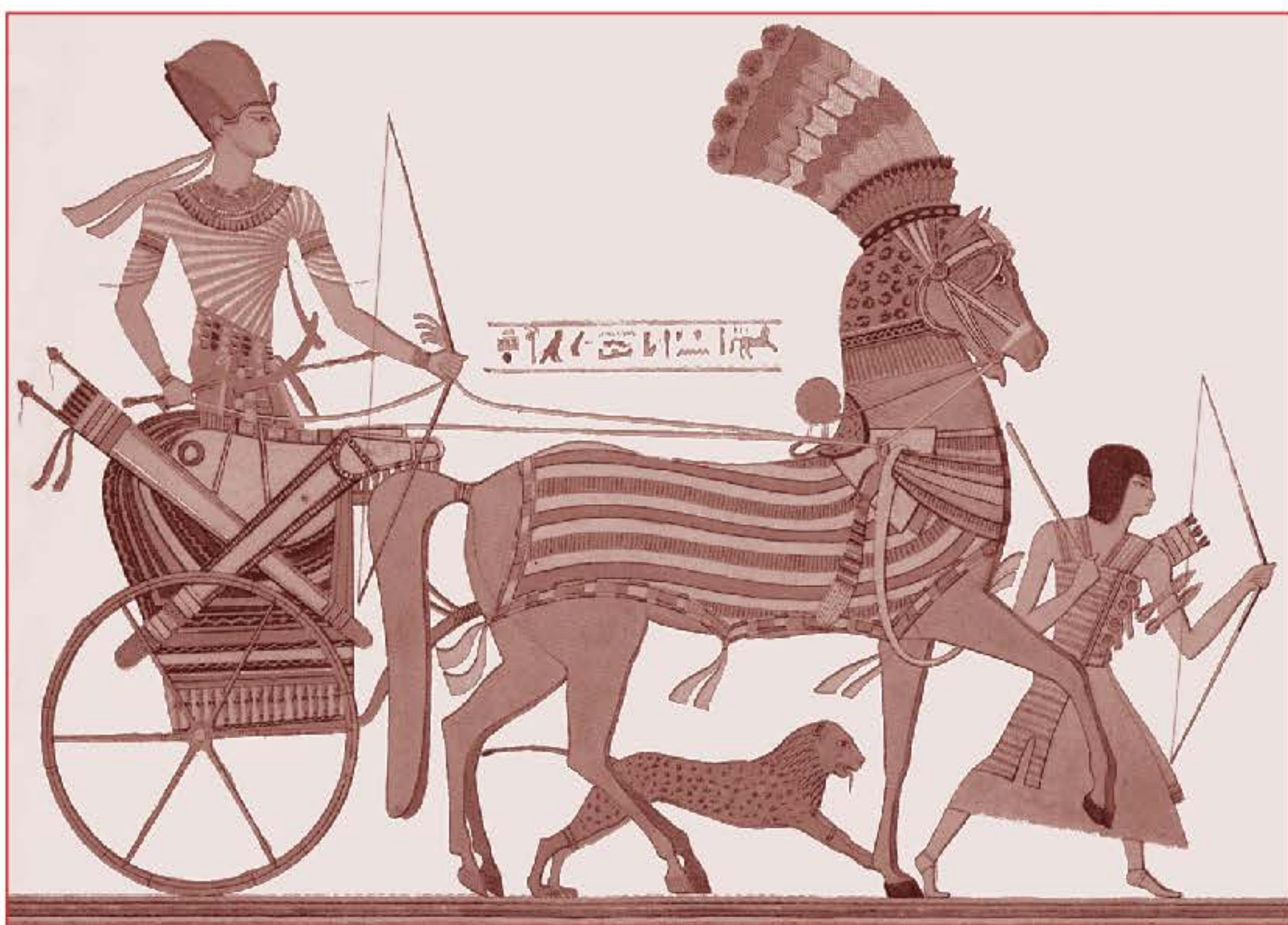
Фараон на колеснице. Рисунок

Царство) находился в верхнем течении Нила, Нижний Египет (Северное Царство) — в дельте Нила. Правителей Египта называют фараоны . Примерно в 3000 г. до н.э. правитель Верхнего Египта Менес (Мена) объединил страну.